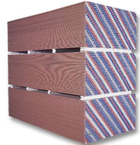
PANEL PARA EXTERIORES