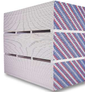
PANEL RESISTENTE AL FUEGO